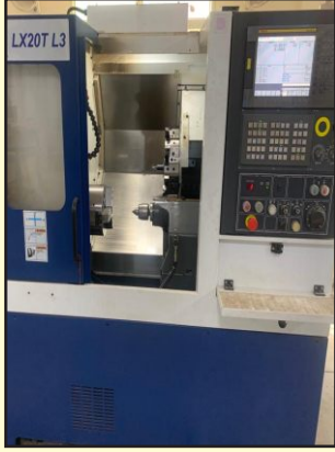
सी एन सी