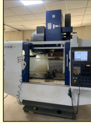
वी एम सी