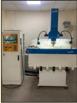
ई डी एम